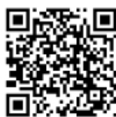
防空演習或空襲時聽到的緊急警報聲音