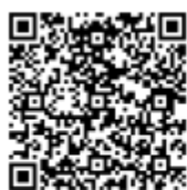
防空演習或空襲時的警報音符圖示